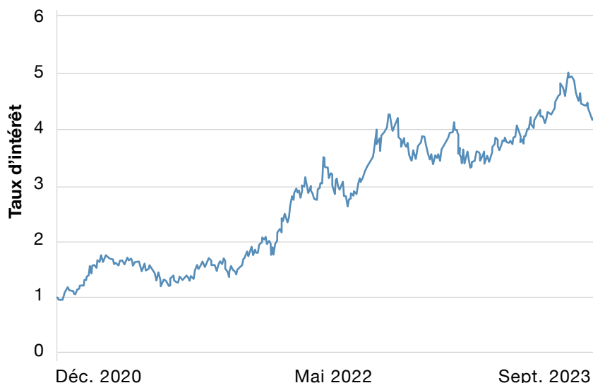
BONS DU TRÉSOR AMÉRICAIN 10 ANS

Les taux d'intérêt suivaient une tendance haussière depuis la pandémie. Cette tendance aura pris fin au cours des derniers mois comme le démontre le graphique des taux des obligations du Trésor américain à 10 ans. Ce renversement de tendance est principalement explicable par des données favorables au niveau de l'inflation et par un revirement des attentes face aux politiques monétaires des banques centrales pour 2024. En d'autres termes, un point d'inflexion a été atteint suite auquel les hausses de taux feront place à des baisses de taux.